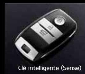
Clé intelligente (Sense)