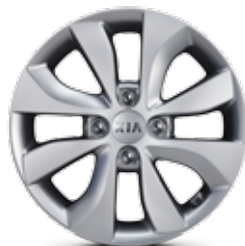
MIND Jantes en aluminium avec pneus 185/65 R15