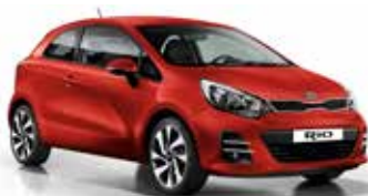
Signal Red (BEG) Pearl