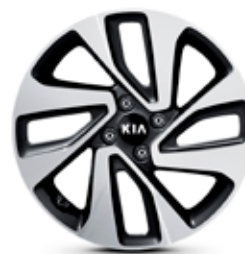
SENSE Jantes en aluminium avec pneus 205/45 R17