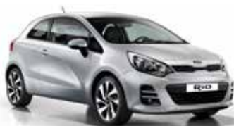
Bright Silver (3D) Metallic