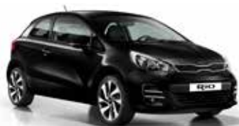
Black (ABP) Pearl