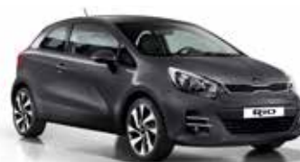
Graphite (ABT) Pearl Metallic