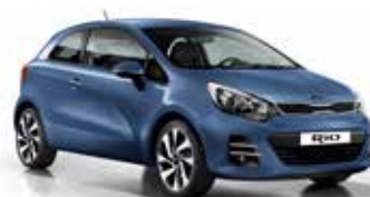
Urban Blue (EU2) Pearl Metallic