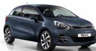
Formal Deep Blue (BLA) Pearl Metallic