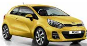
Digital Yellow (DYS) Solid*