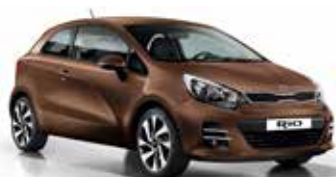
Wendy Brown (DBS) Pearl Metallic