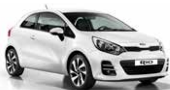
Clear White (UD) Solid