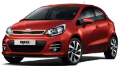
Signal Red (BEG) Pearl