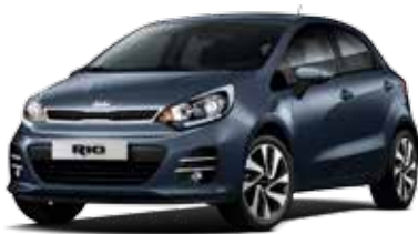
Formal Deep Blue (BLA) Pearl Metallic