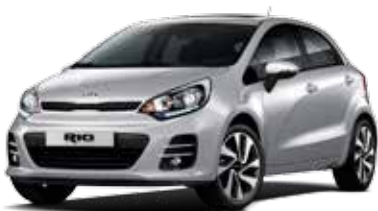
Bright Silver (3D) Metallic