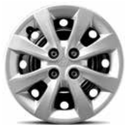
LOUNGE - EASY - FUSION Jantes en acier 15" avec pneus 185/65 R15 et enjoliveurs