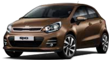
Wendy Brown (DBS) Pearl Metallic