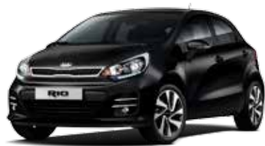
Black (ABP) Pearl