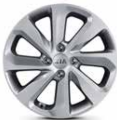
WORLD EDITION Jantes en aluminium avec pneus 195/55 R16