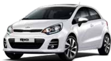
Clear White (UD) Solid