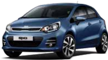
Urban Blue (EU2) Pearl Metallic