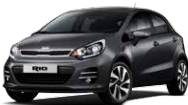
Graphite (ABT) Pearl Metallic