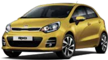
Digital Yellow (DYS) Solid*