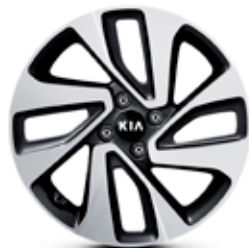
SENSE Jantes en aluminium avec pneus 205/45 R17