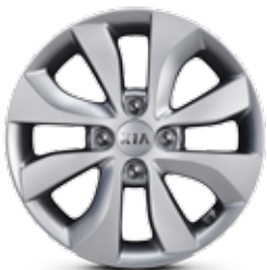
MIND Jantes en aluminium avec pneus 185/65 R15