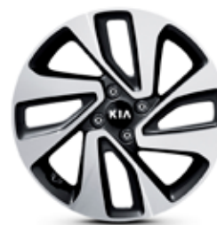
SENSE Jantes en aluminium avec pneus 205/45 R17