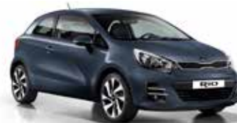
Formal Deep Blue (BLA) Pearl Metallic