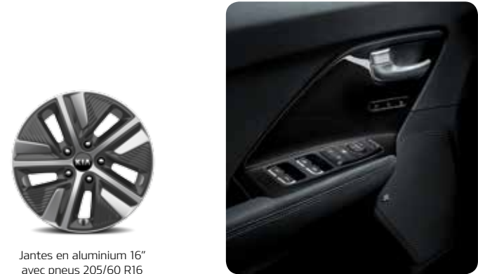
Jantes en aluminium 16" avec pneus 205/60 R16