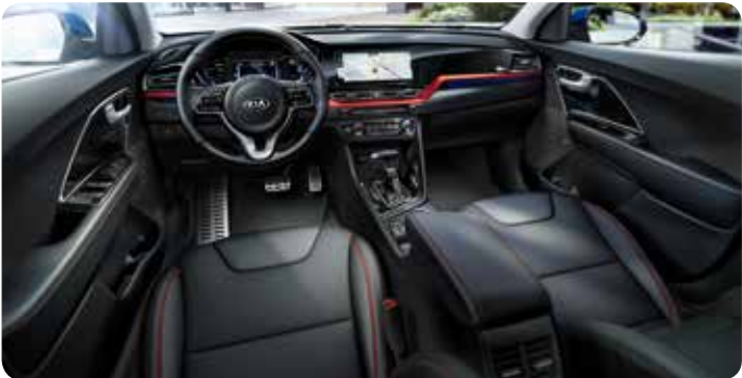
Sellerie en cuir noir avec coutures rouges/oranges (option)