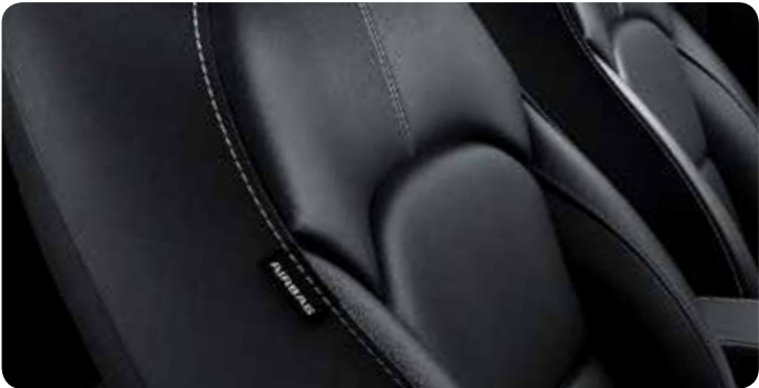
Sellerie en cuir noir (en option via le Pack cuir)