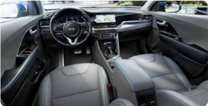
Sellerie en cuir gris avec coutures bleues (option gratuite)