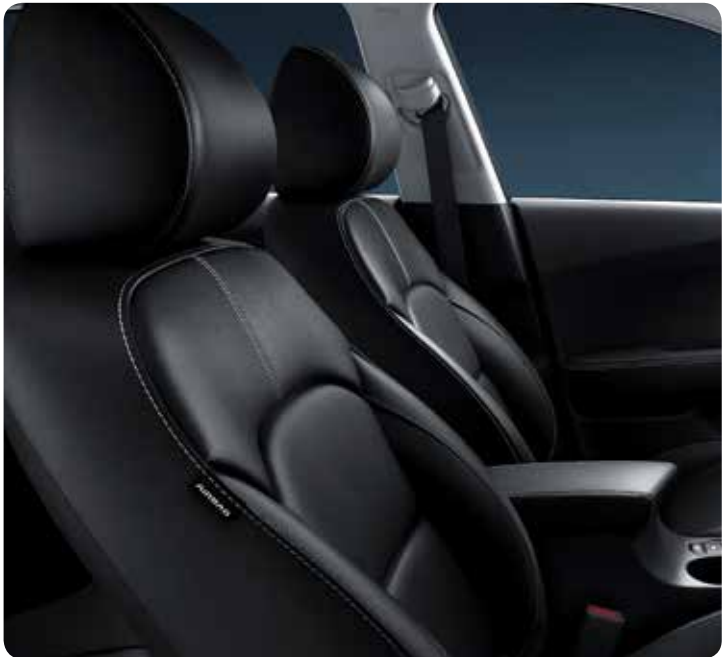
Sellerie en cuir noir