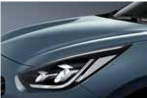
Horizon Blue (BBL)**