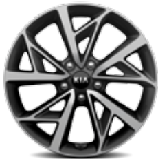
Jantes en aluminium 18” avec pneus 225/45 R18 (HEV)