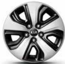
Jantes en aluminium 16" avec enjoliveurs et pneus 205/60 R16