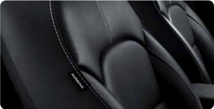
Sellerie en cuir noir