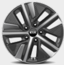
Jantes en aluminium 16" avec pneus 205/60 R16