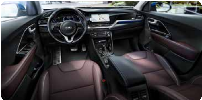
Sellerie en cuir couleur prune (option)