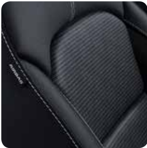
Sellerie en tissu noir