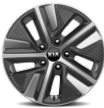
Jantes en aluminium 16” avec pneus 205/60 R16 (PHEV)