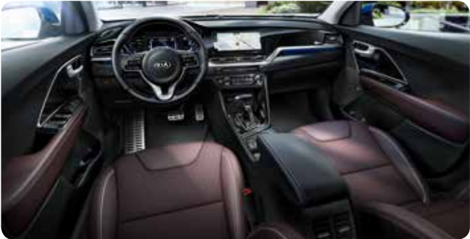
Sellerie en cuir couleur prune (option)