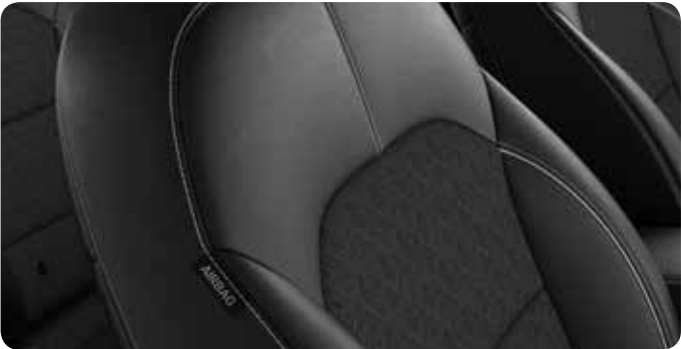
Sellerie mi-cuir / mi-tissu noir