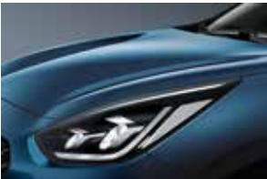
Deep Cerulean Blue (C3U)**