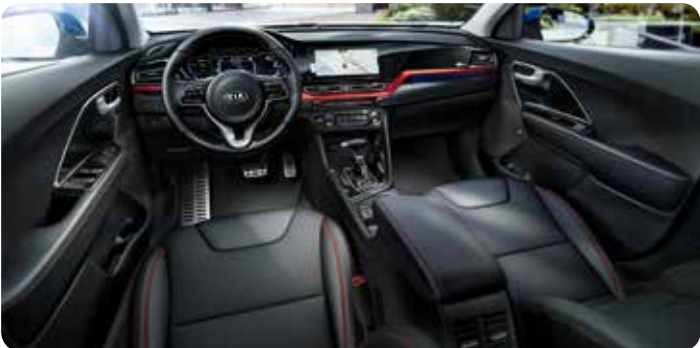
Sellerie en cuir noir avec coutures rouges/oranges (option)