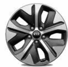
Jantes en aluminium 17” avec pneus 215/55