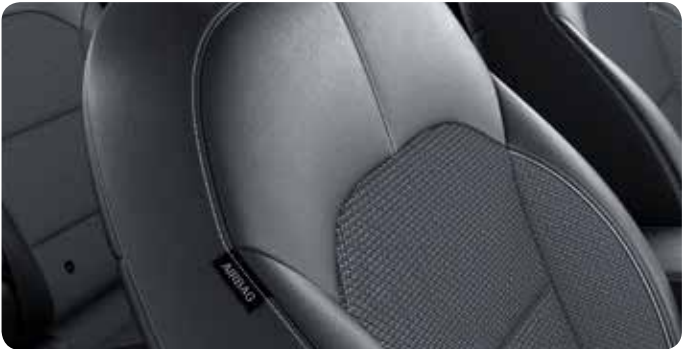
Sellerie mi-cuir / mi-tissu gris