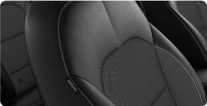
Sellerie mi-cuir / mi-tissu noir