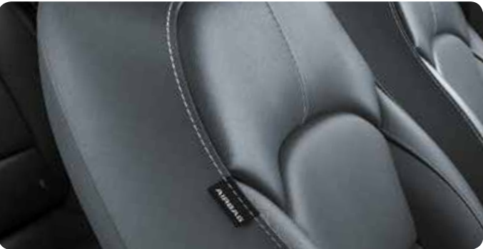
Sellerie en cuir gris (optionnel)