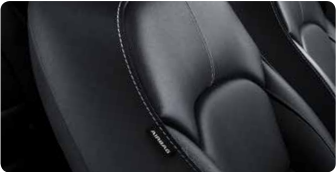
Sellerie en cuir noir (optionnel)