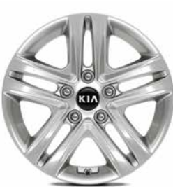
Jantes en aluminium 16" avec pneus 205/55