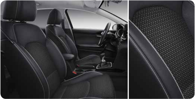
Sellerie mi-cuir / mi-tissu noir (Sense)