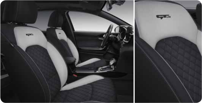
Sellerie mi-cuir / mi-tissu 'GT Line'