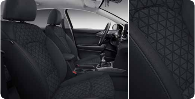
Sellerie en tissu noir (Business Line)