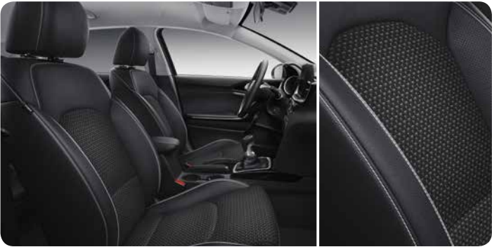
Sellerie mi-cuir / mi-tissu noir