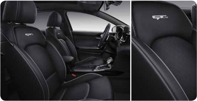
Option: Sellerie en cuir avec surpiqûres grises