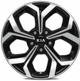
Jantes en aluminium 17" avec pneus 225/45 (option Pack Design sur More)