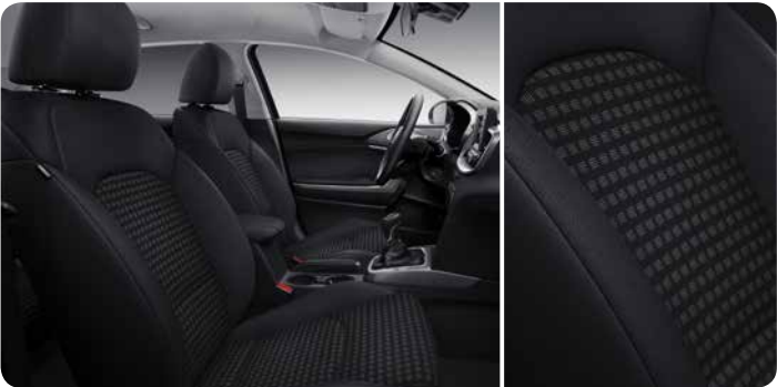
Sellerie en tissu noir