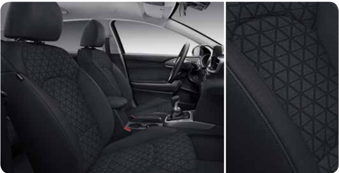
Sellerie en tissu noir