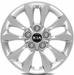
Jantes en acier 16" avec pneus 205/55 et enjoliveurs