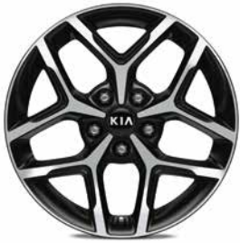
Jantes en aluminium 17" avec pneus 225/45