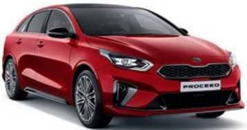
Infra Red (AA9) (Pas disponible en GT)