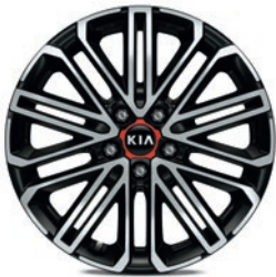
Jantes en aluminium 18” avec pneus 225/40