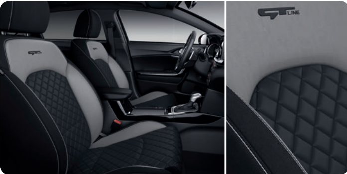
Sellerie mi-cuir / mi-tissu 'GT-Line'