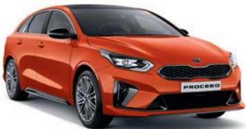
Orange Fusion (RNG)