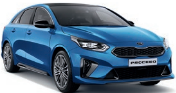
Blue Flame (B3L)