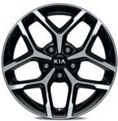
Jantes en aluminium 17” avec pneus 225/45