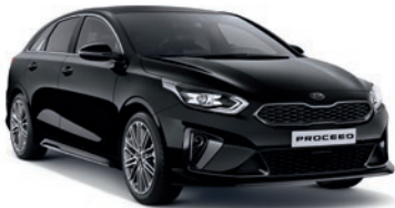
Black Pearl (1K)