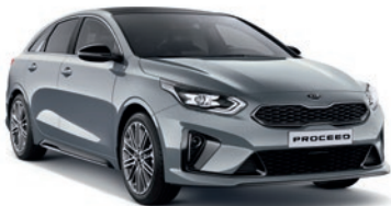
Lunar Silver (CSS)