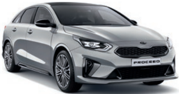
Sparkling Silver (KCS)