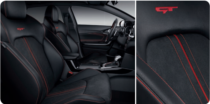
Sellerie en cuir / suède avec surpiqûres rouges