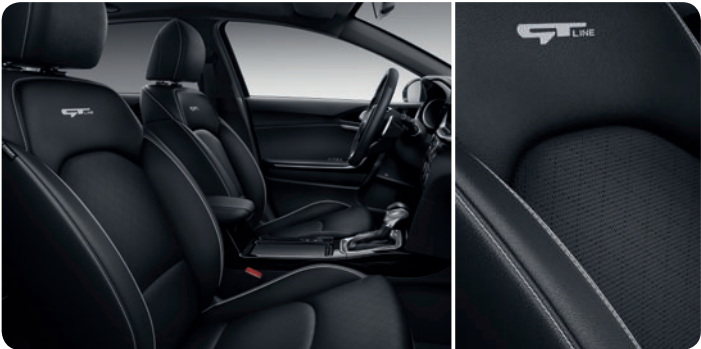
Option GT Line: Sellerie en cuir avec surpiqûres grises