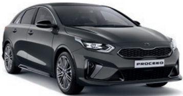
Dark Penta Metal (H8G)