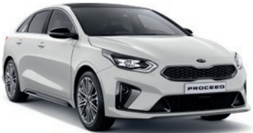
Deluxe White Pearl (HW2)