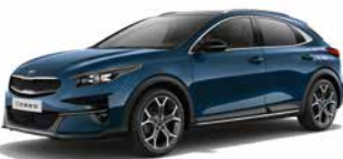
Cosmos Blue (CB7)