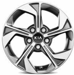
Jantes en aluminium 16" avec pneus 205/60