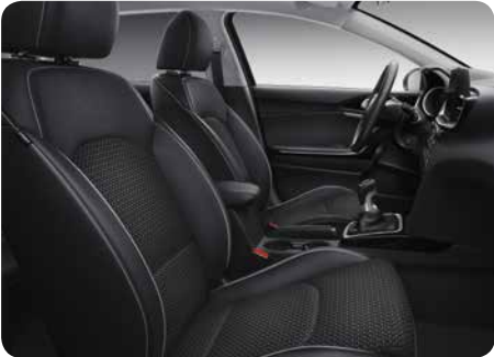
Sellerie mi-cuir / mi- tissu noir (More et Navi Edition)