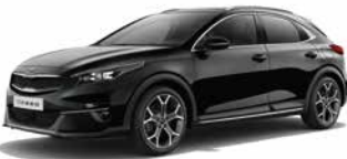
Black Pearl (1K)