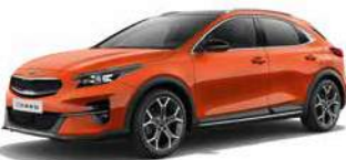
Orange Fusion (RNG)