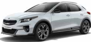
Cassa White (WD)**