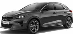
Penta Metal (H8G)