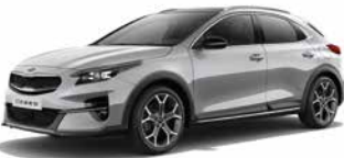
Sparkling Silver (KCS)