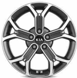
Jantes en aluminium 18" avec pneus 235/45 (en option)