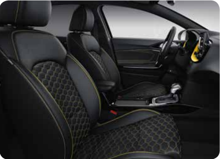
Sellerie mi-cuir / mi- tissu noir et jaune (en option sur More via Pack Yellow)