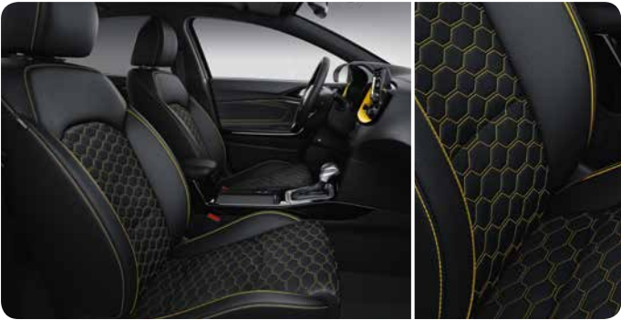
Sellerie mi-cuir / mi- tissu noir et jaune (en option via Pack Yellow)