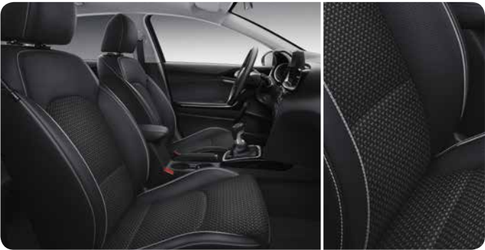
Sellerie mi-cuir / mi- tissu noir