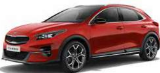
Infra Red (AA9)