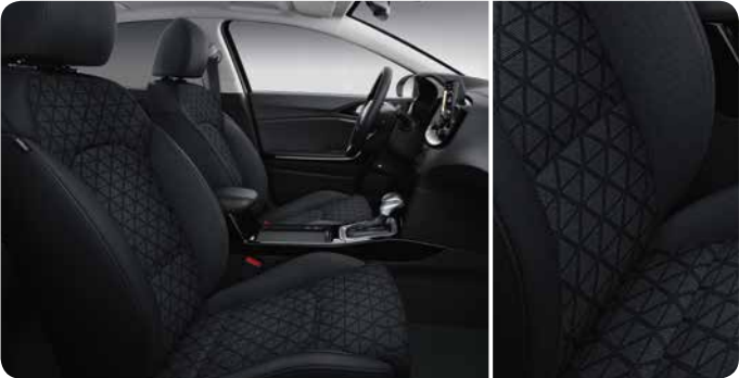
Sellerie en tissu noir