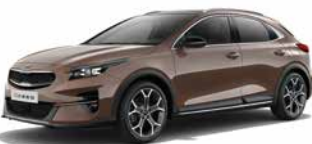
Copper Stone (L2B)