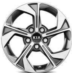
Jantes en aluminium 16" avec pneus 205/60