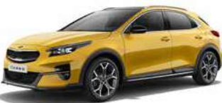
Quantum Yellow (YQM)