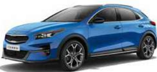
Blue Flame (B3L)