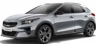
Lunar Silver (CCS)