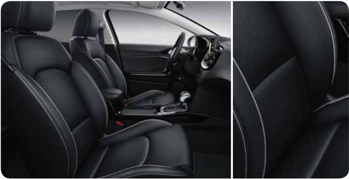
Sellerie en cuir noir (en option)