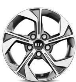
Jantes en aluminium 16" avec pneus 205/60