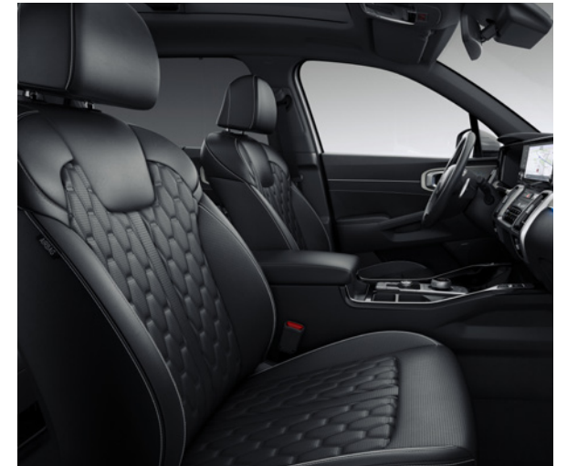
Cuir Nappa Matelassé - Noir / Surpiqûres et Passepoils - Gris / Ciel de Toit - Noir (en option sur Pace via le Pack Premium Nappa)