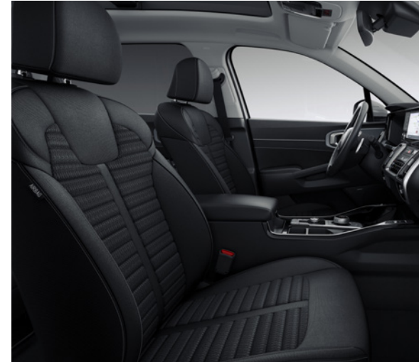
Tissu - Noir / Ciel de Toit - Gris (de série sur Pulse)