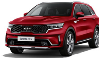
Runway Red (CR5)