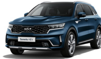
Gravity Blue (B4U)