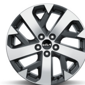
Jantes en alliage 18" avec pneus 235/60 De série sur Pulse Diesel