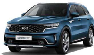
Mineral Blue (M4B)