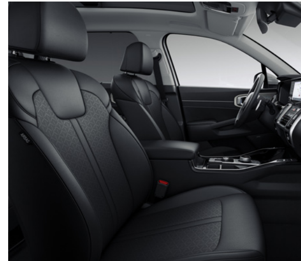
Cuir - Noir / Ciel de Toit - Gris (de série sur Pace V2 et Pace, en option sur Pulse via le Pack Style)