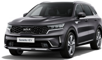
Platinum Graphite (ABT)