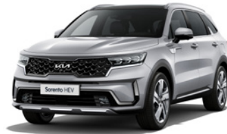
Silky Silver (4SS)