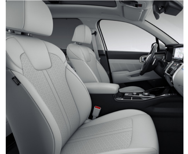
Cuir - Gris / Ciel de Toit - Gris (de série sur Pace V2, en option sur Pulse via le Pack Style)