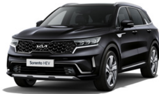
Aurora Black Pearl (ABP)