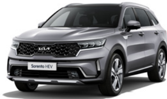
Steel Grey (KLG)