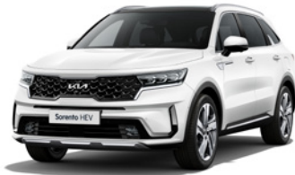
Snow Pearl White (SWP)