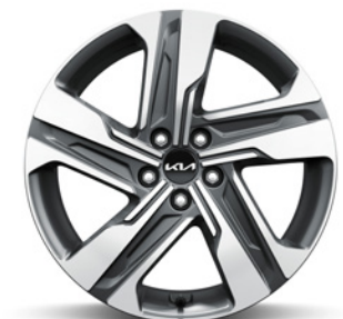
Jantes en alliage 19" avec pneus 235/55 De série sur Pace et Pace V2