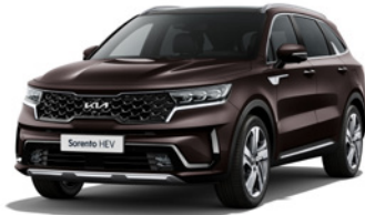
Essence Brown (BE2)