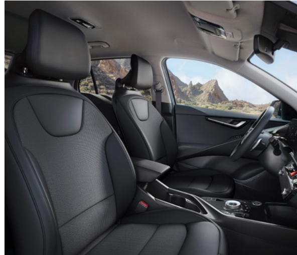
Tissu/Cuir artificiel - Noir (de série sur Pure et Pulse) Stof/Kunstleder - Zwart (standaard op Pure en Pulse)