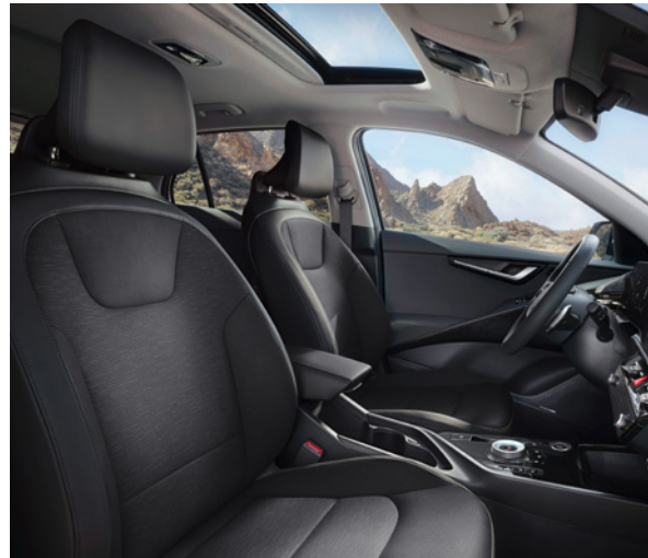
Cuir artificiel - Noir (de série sur Pace) Kunstleder - Zwart (standaard op Pace)