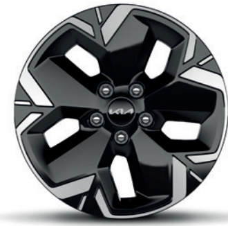
Jantes en alliage 17" et pneus 215/55 R17 17" lichtmetalen velgen met 215/55 R17 banden