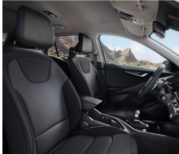
Tissu - Noir (de série sur Business) Stof - Zwart (standaard op Business)