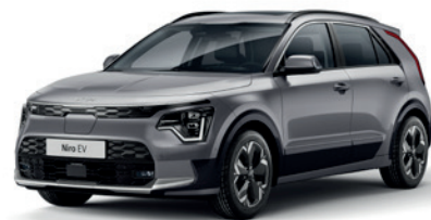
Steel Grey (KLG)** (Disponible en option sur Pace avec montant arrière noir) (Met zwarte achterstijl - beschikbaar als optie op Pace)