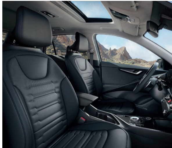
Cuir artificiel - Noir (de série sur Business Plus) Kunstleder - Zwart (standaard op Business Plus)