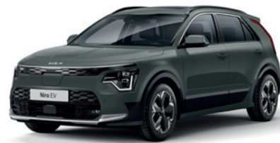
Cityscape Green (CGE)** (Disponible en option sur Pace avec montant arrière noir) (Met zwarte achterstijl - beschikbaar als optie op Pace)