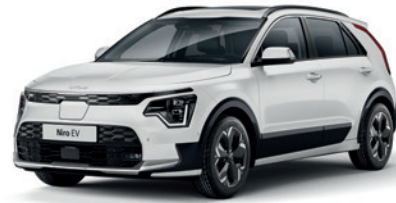
Snow White Pearl (SWP)** (Disponible en option sur Pace avec montant arrière noir) (Met zwarte achterstijl - beschikbaar als optie op Pace)