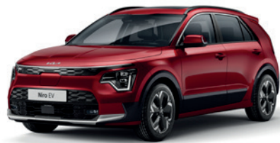
Runway Red (CR5)** (Disponible en option sur Pace avec montant arrière noir) (Met zwarte achterstijl - beschikbaar als optie op Pace)