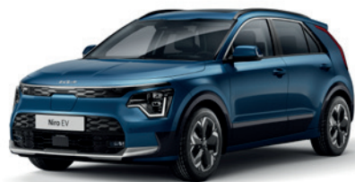
Mineral Blue (M4B)** (Disponible en option sur Pace avec montant arrière noir) (Met zwarte achterstijl - beschikbaar als optie op Pace)