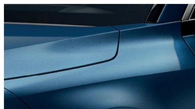
Mineral Blue (M4B)** (Disponible en option sur Pace avec montant arrière noir) (Met zwarte achterstijl - beschikbaar als optie op Pace)