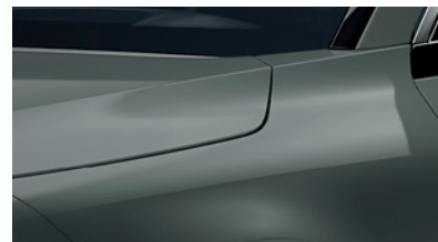
Cityscape Green (CGE)** (Disponible en option sur Pace avec montant arrière noir) (Met zwarte achterstijl - beschikbaar als optie op Pace)