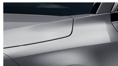
Steel Grey (KLG)** (Disponible en option sur Pace avec montant arrière noir) (Met zwarte achterstijl - beschikbaar als optie op Pace)