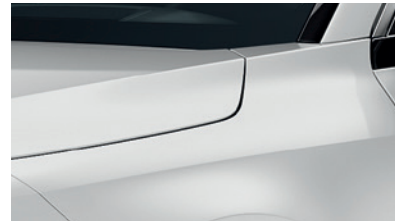
Snow White Pearl (SWP)** (Disponible en option sur Pace avec montant arrière noir) (Met zwarte achterstijl - beschikbaar als optie op Pace)