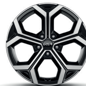
Jantes en alliage 18" avec pneus 225/45 R18 (de série sur Pace) (PHEV perte d'autonomie moyenne de 6 km) 18" lichtmetalen velgen met banden 225/45 R18 (standaard op Pace) (PHEV gemiddeld verlies van 6 km autonomie)