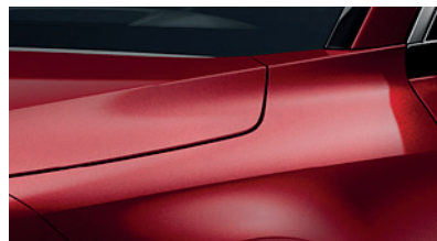
Runway Red (CR5)** (Disponible en option sur Pace avec montant arrière noir) (Met zwarte achterstijl - beschikbaar als optie op Pace)