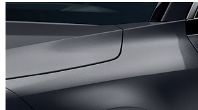
Interstellar Grey (AGT)** (Disponible en option sur Pace avec montant arrière noir) (Met zwarte achterstijl - beschikbaar als optie op Pace)