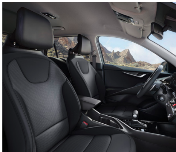
Tissu - Noir (de série sur Pure) Stof - Zwart (standaard op Pure)