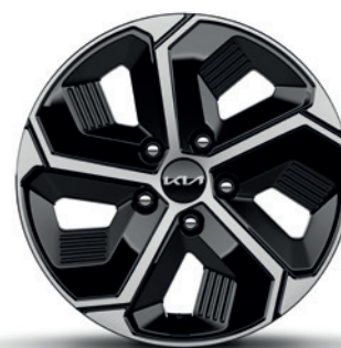
Jantes en alliage 16" avec pneus 205/60 R16 (de série sur Pure & Pulse, option sur Pace (PHEV)) 16" lichtmetalen velgen met banden 205/60 R16 (standaard op Pure & Pulse, optie op Pace (PHEV))