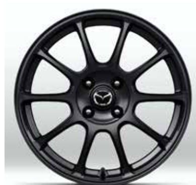
Jantes en alliage RAYS forged 16" avec pneus 195/50 R16 sur HOMURA (uniquement sur Skyactiv-G 132 ch)