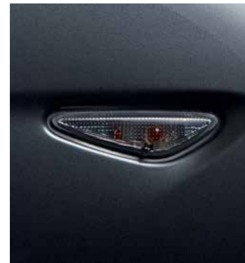
Indicateurs latéraux (verre "smoked")