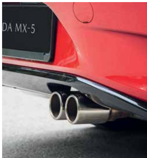
Échappement sport Bastuck