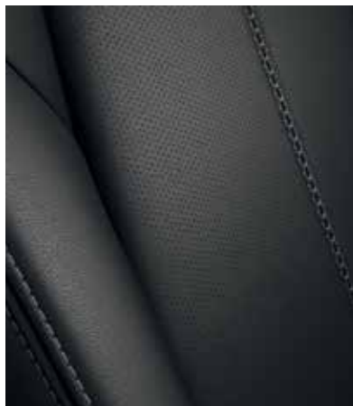
Sellerie en cuir noir avec surpiqûres 'Silver' (EXCLUSIVE-LINE)