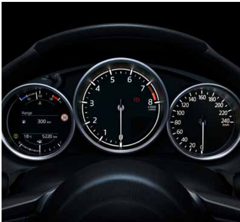
Ordinateur de bord avec écran TFT 4,6" en couleur