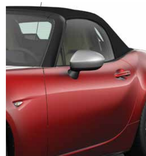
Coques de rétroviseur (argentée)