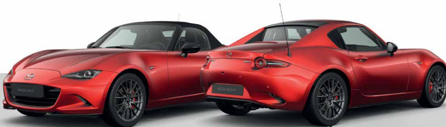
Modèles illustrés : Mazda MX-5 Roadster & RF Homura SKYACTIV-G 132 ch