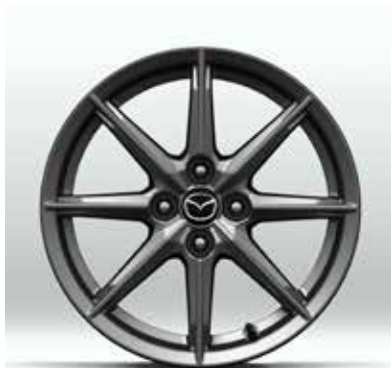
Jantes en alliage 'Bright' 16" avec pneus 195/50 R16 sur EXCLUSIVE-LINE & KAZARI (uniquement sur Skyactiv-G 132 ch)