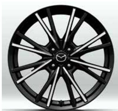
Jantes en alliage 'Black Metallic & Machining' 17" avec pneus 205/45 R17 sur EXCLUSIVE-LINE & KAZARI (uniquement sur Skyactiv-G 184 ch)