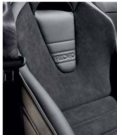
Sièges Recaro®* avec revêtement en cuir noir, Alcantara® noir, surpiqûres 'Silver' et passepoil gris (HOMURA)