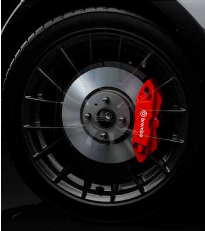
Jantes en alliage BBS 17" avec pneus 205/45 R17 et freins Brembo™ (uniquement sur SKYACTIV-G 184 ch)