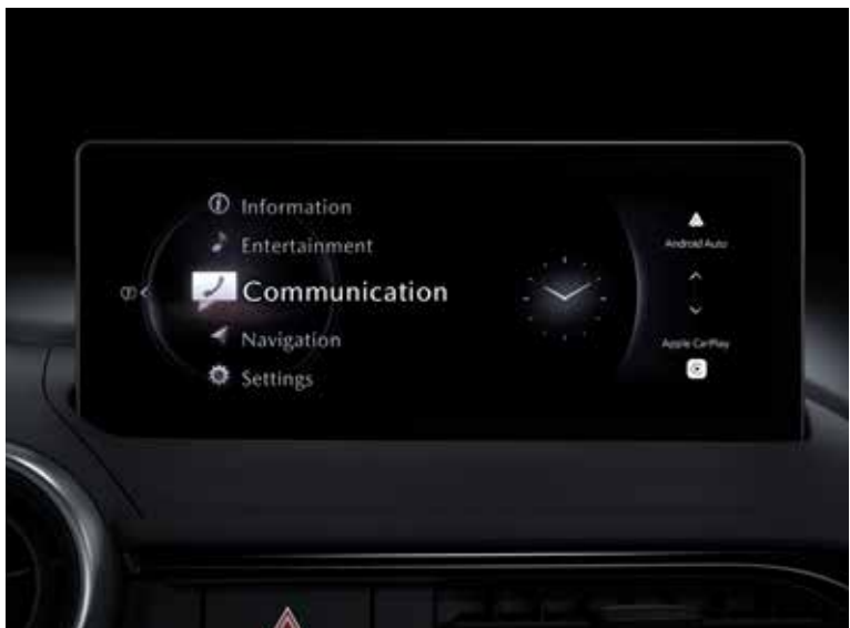
HMI Commander et Mazda Connect avec écran couleur tactile 8.8"