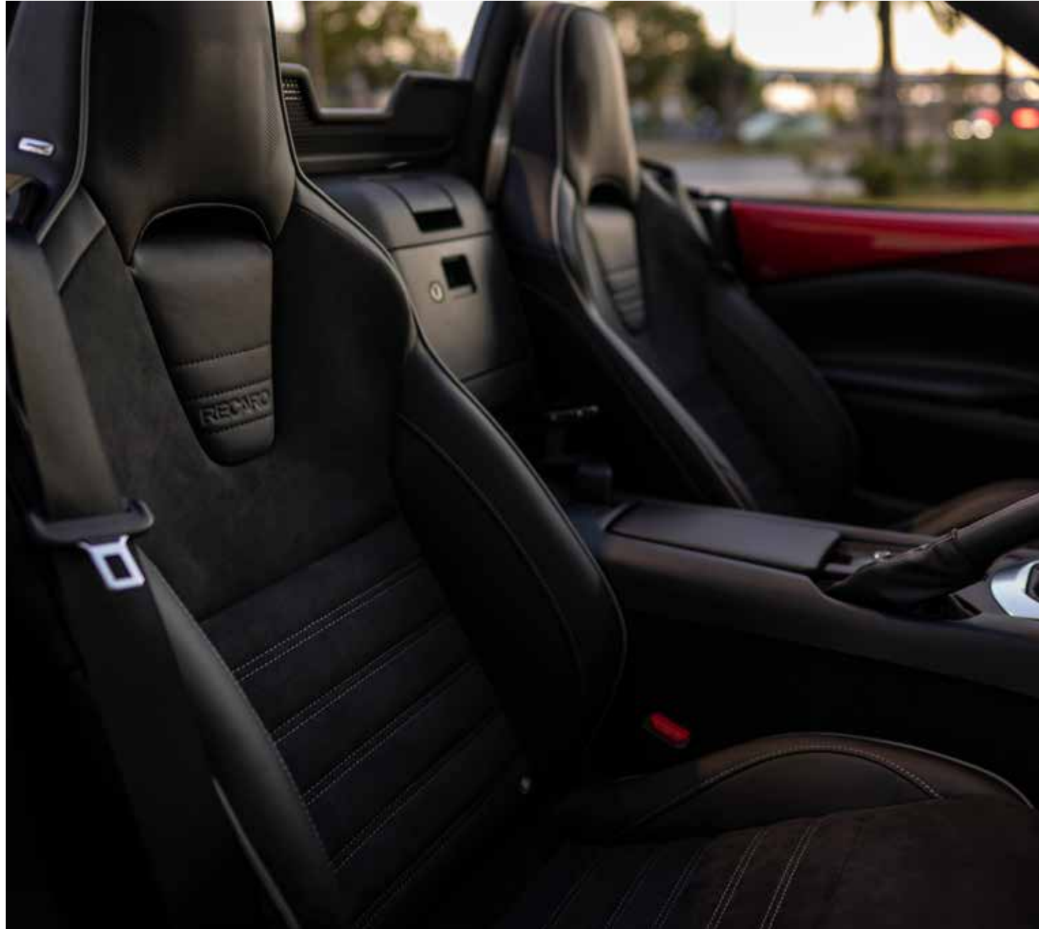
Sièges Recaro® avec revêtement en cuir noir et Alcantara® noir, surpiqûres 'Silver' et passepoil gris *