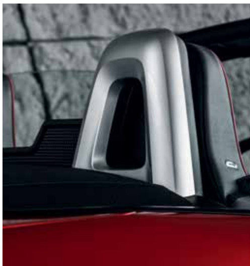
Coques de rétroviseur, revêtement fashion bar et garniture de montant avant argentés (uniquement sur Roadster)