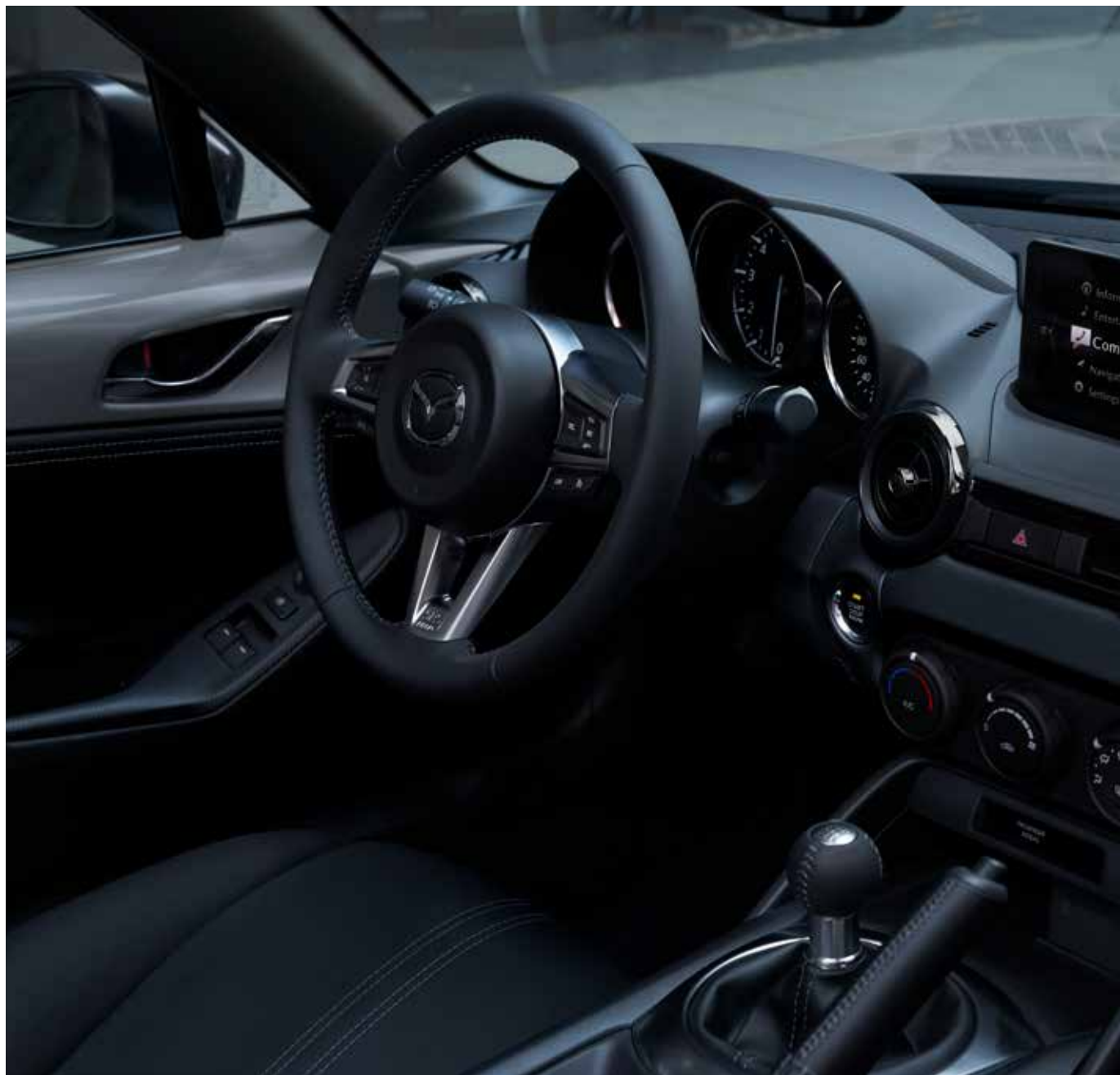
Sellerie en tissu noir et suédine noir avec surpiqûres 'Silver'