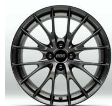
Jantes en alliage BBS forged 17" avec pneus 205/45 R17 sur HOMURA (uniquement sur Skyactiv-G 184 ch)