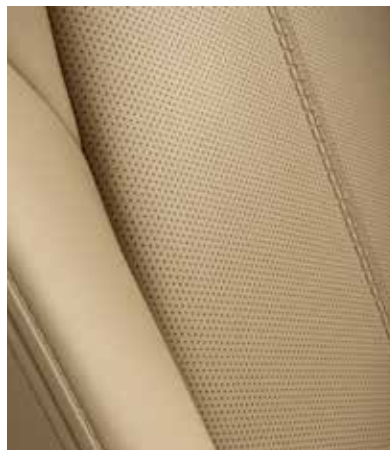
Sellerie en cuir Nappa Tan avec surpiqûres contrastantes (KAZARI)