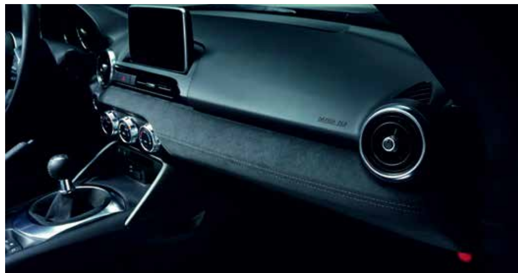
Panneau de porte inférieur, panneau de bord, soufflet de frein à main et soufflet de levier de changement de vitesse en Alcantara®