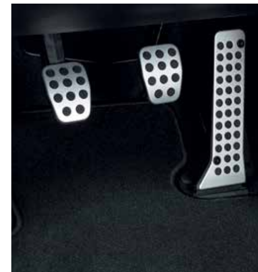
Pédales en aluminium