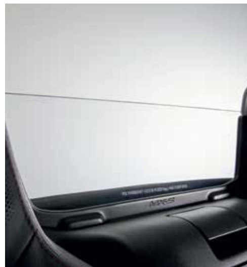
Saut de vent transparent (Roadster)