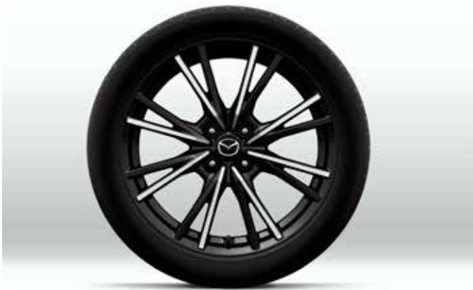
Jantes en alliage 'Black Metallic & Machining' 17" avec pneus 205/45 R17 (uniquement sur SKYACTIV-G 184 ch)