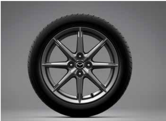
Jantes en alliage 'Bright' 16" avec pneus 195/50 R16