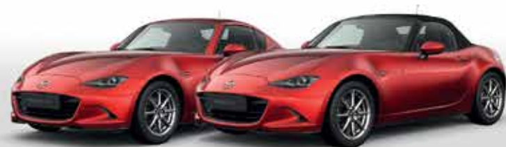
SOUL RED CRYSTAL (46V)*