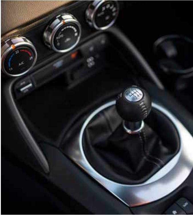
Climatisation automatique, Sièges chauffants à l'avant et pommeau du levier de vitesse gainés de cuir avec surpiqûres 'Silver'