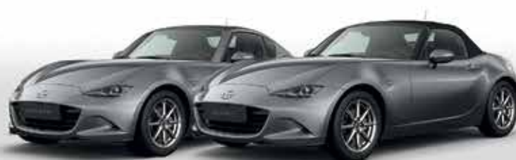
MACHINE GREY (46G)*