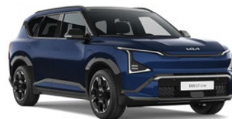
Dark Ocean Blue (BU3)