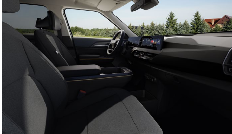
Tissu - Noir & Ciel de Toit - Gris (de série sur Business) Stof - Zwart & Dakhemel - Grijs (standaard op Business)