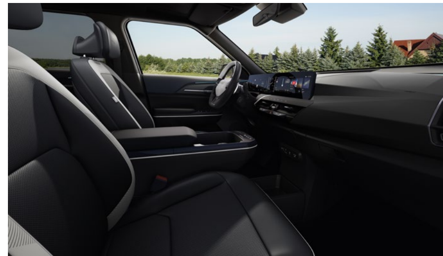
Cuir vegan - Noir / Blanc & Ciel de Toit - Noir (de série sur GT Line) Vegan leder - Zwart / Wit & Dakhemel - Zwart (standaard op GT Line)