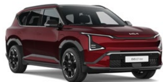
Magma Red (OVR)