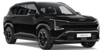
Fusion Black (FSB)