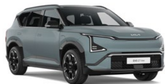
Iceberg Green Matt (IEB)** (Uniquement disponible sur GT Line) (Enkel beschikbaar op GT Line)