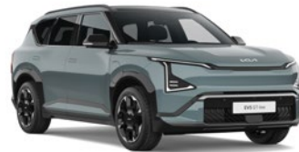
Iceberg Green (IEG)