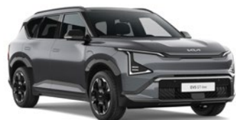
Gravity Grey (KDG)