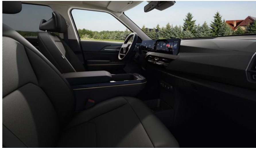
Tissu / Cuir vegan - Noir & Ciel de Toit - Gris (de série sur Business Plus) Stof / Vegan leder - Zwart & Dakhemel - Grijs (standaard op Business Plus)