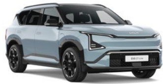
Frost Blue (EBB)*