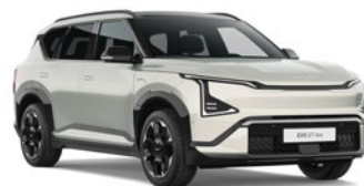
Ivory Silver (ISG)