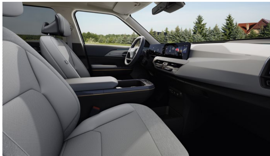
Tissu / Cuir vegan - Gris & Ciel de Toit - Gris (de série sur Business Plus) Stof / Vegan leder - Grijs & Dakhemel - Grijs (standaard op Business Plus)