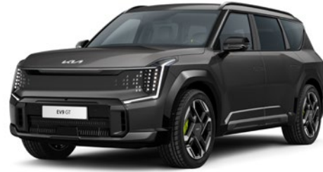
Panthera Metal (P2M)