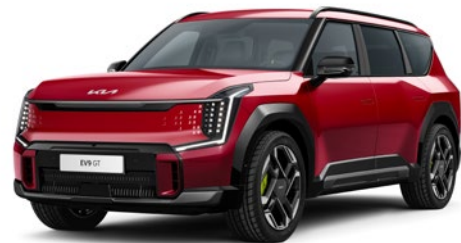
Flare Red (C7R)