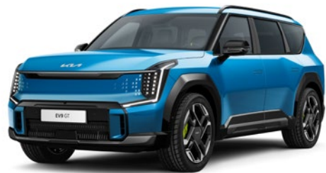
Ocean Blue Glossy (OBG)