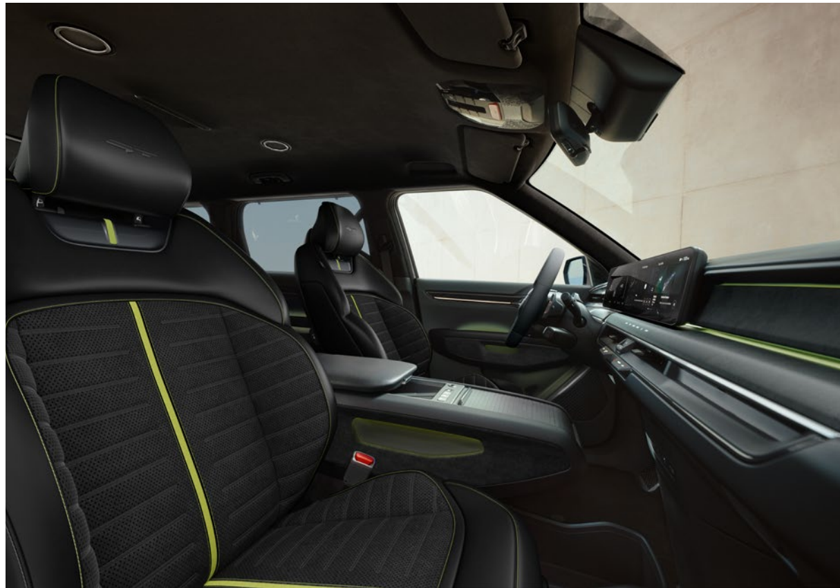
Sellerie Alcantara/Cuir Vegan - Noir / Gris + Vert & ciel de Toit - Suède - Noir (de série) Vegan Leder/Alcantara Zetelbekleding - Zwart / Grijs + Groen & dakhemel - Suede - Zwart (standaard)