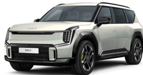
Ivory Silver Glossy (ISG)