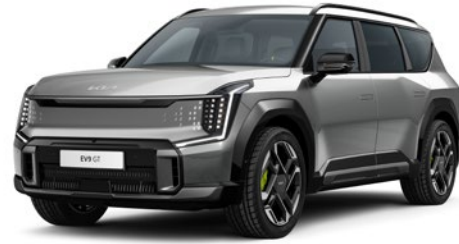
Pebble Gray (DFG)