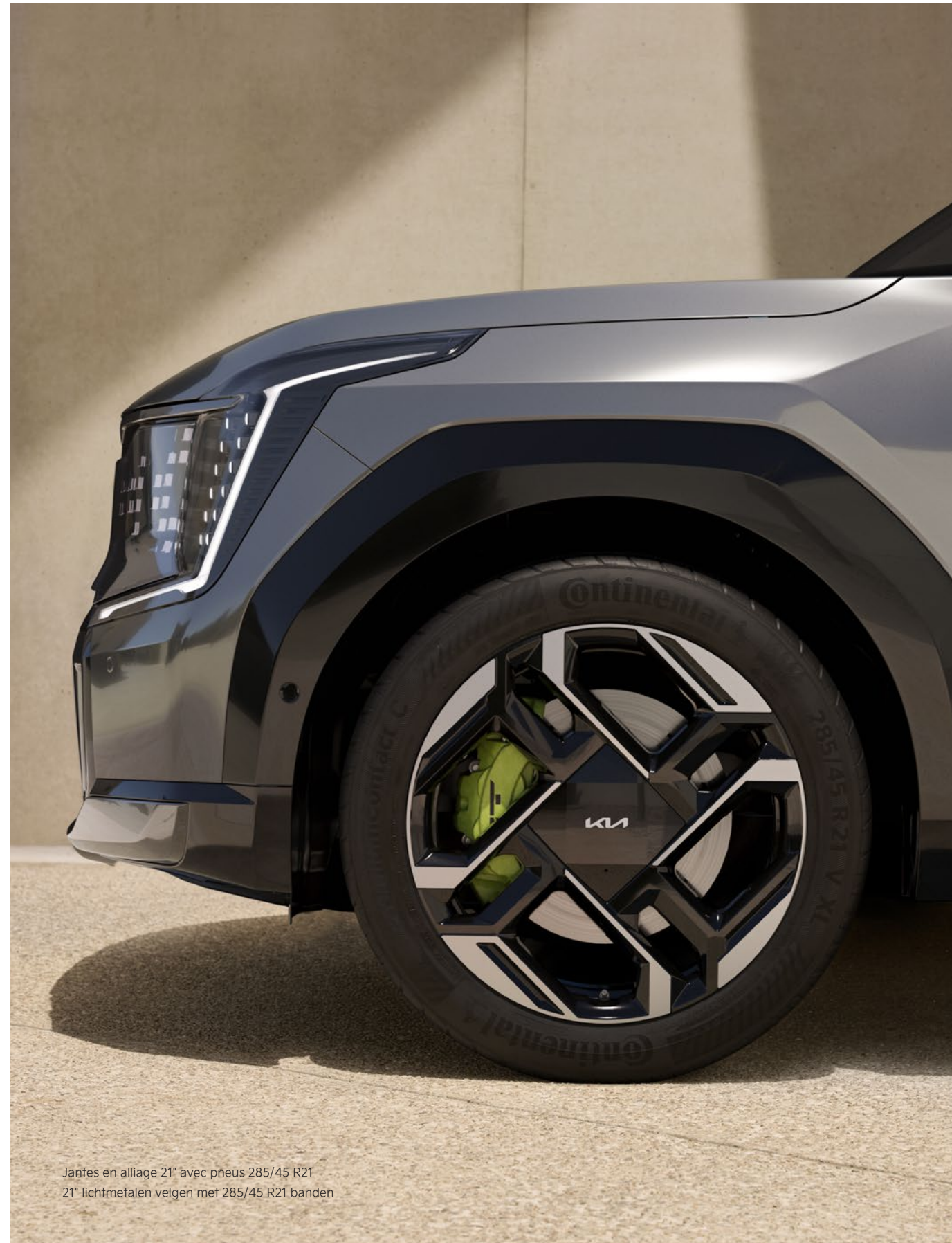
Jantes en alliage 21" avec pneus 285/45 R21 21" lichtmetalen velgen met 285/45 R21 banden