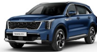
Mineral Blue (M4B)