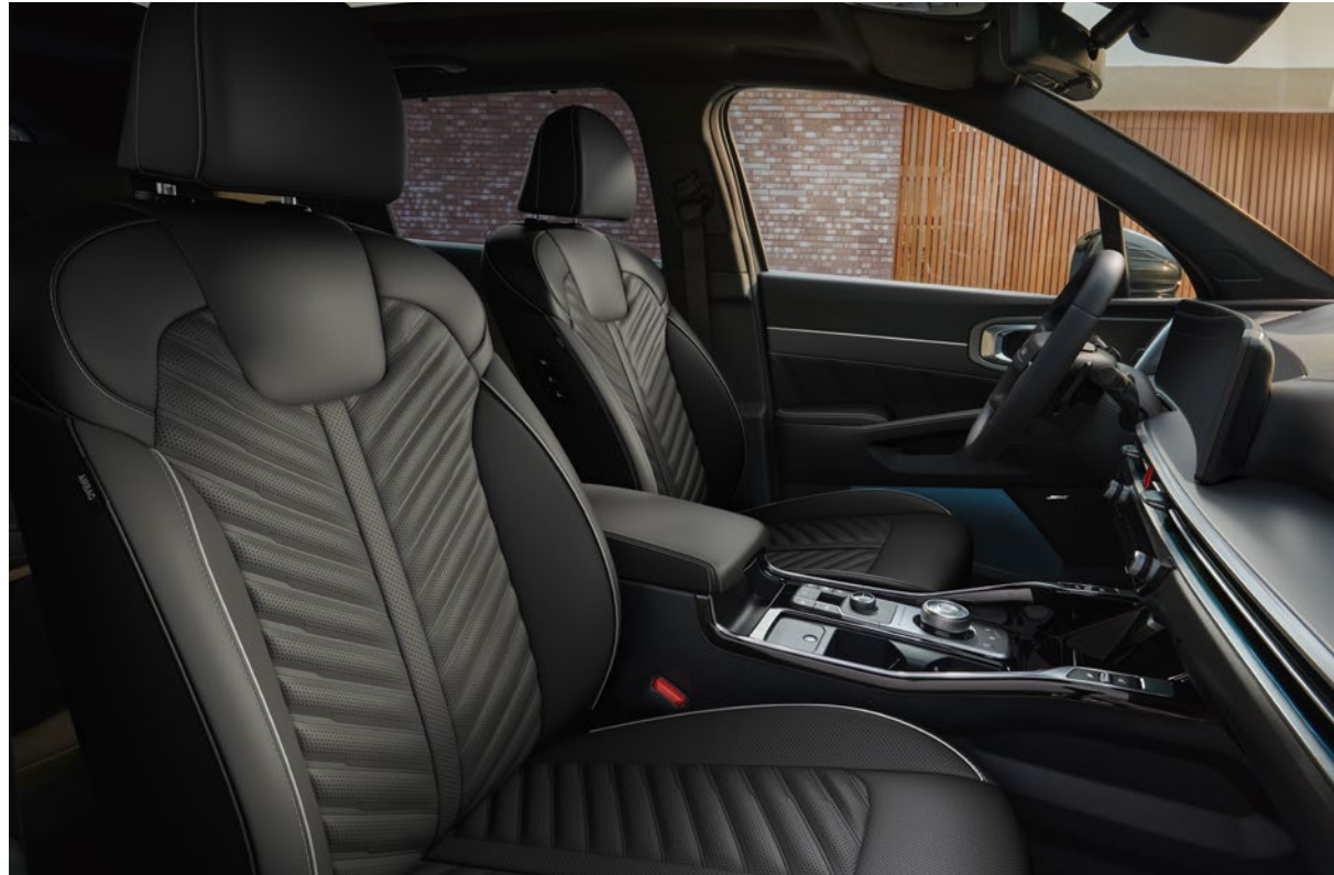
Cuir Nappa - Noir / Ciel de toit - Noir (de série sur Pace) Nappa leder - Zwart / Dakhemel - Zwart (standaard op Pace)