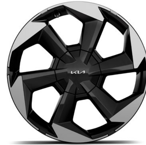
Jantes en alliage 19" avec pneus 235/55 De série sur Pulse & Pace 19" lichtmetalen velgen met 235/55 banden Standaard op Pulse & Pace