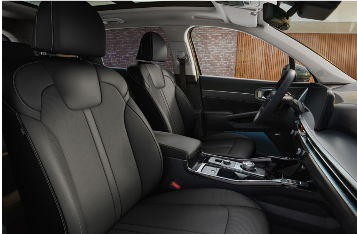
Cuir - Noir / Ciel de toit - Gris (de série sur Pulse) Leder - Zwart / Dakhemel - Grijs (standaard op Pulse)