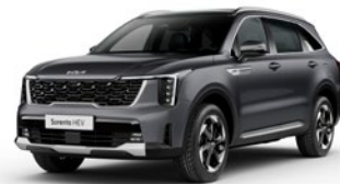
Interstellar Gray (AGT)