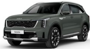
Cityscape Green (CGE)