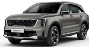
Volcanic Sand (BN4)