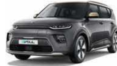
Gravity Grey + Platinum Gold (SE1)