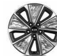
Jantes en aluminium 17" avec pneus 215/55