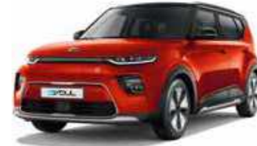
Mars Orange + Cherry Black (SE3)