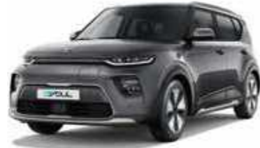
Gravity Grey (KDG)