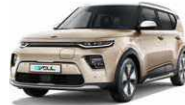
Platinum Gold + Clear White (SE4)