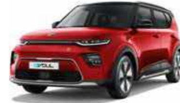
Inferno Red + Cherry Black (AH4)