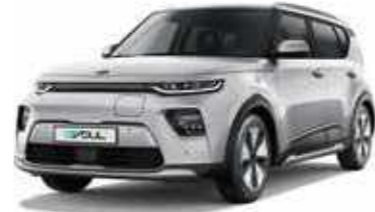
Sparkling Silver (KCS)