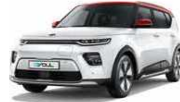
Clear White + Inferno Red (AH1)