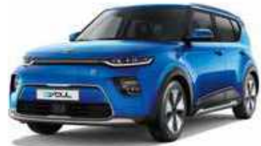
Neptune Blue (B3A)