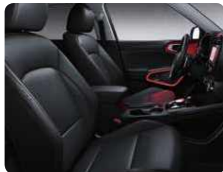
Sellerie en cuir noir avec surpiqûres rouges (option)