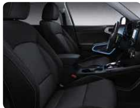
Sellerie en tissu noir (de série) ou gris (option gratuite) Sellerie en tissu noir avec surpiqûres vertes (option)