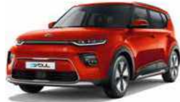
Mars Orange (M3R)