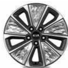
Jantes en aluminium 17" avec pneus 215/55