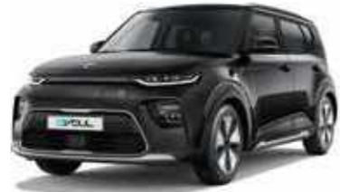
Cherry Black (9H)