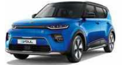
Neptune Blue + Cherry Black (SE2)