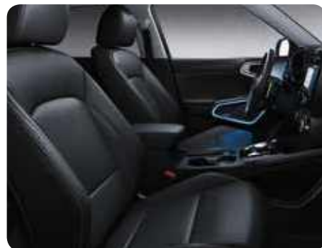
Sellerie en cuir noir (option)