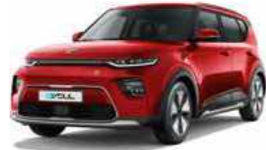
Inferno Red (AJR)