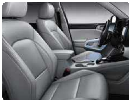
Sellerie en cuir gris (option)