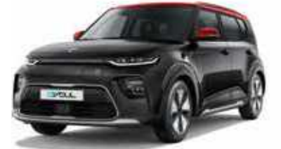
Cherry Black + Inferno Red (AH5)